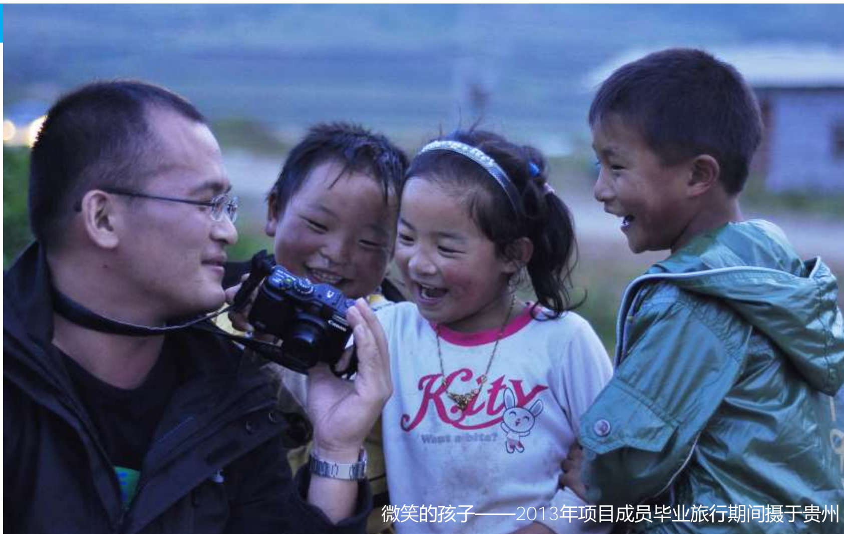
微笑的孩子——2013年项目成员毕业旅行期间摄于贵州