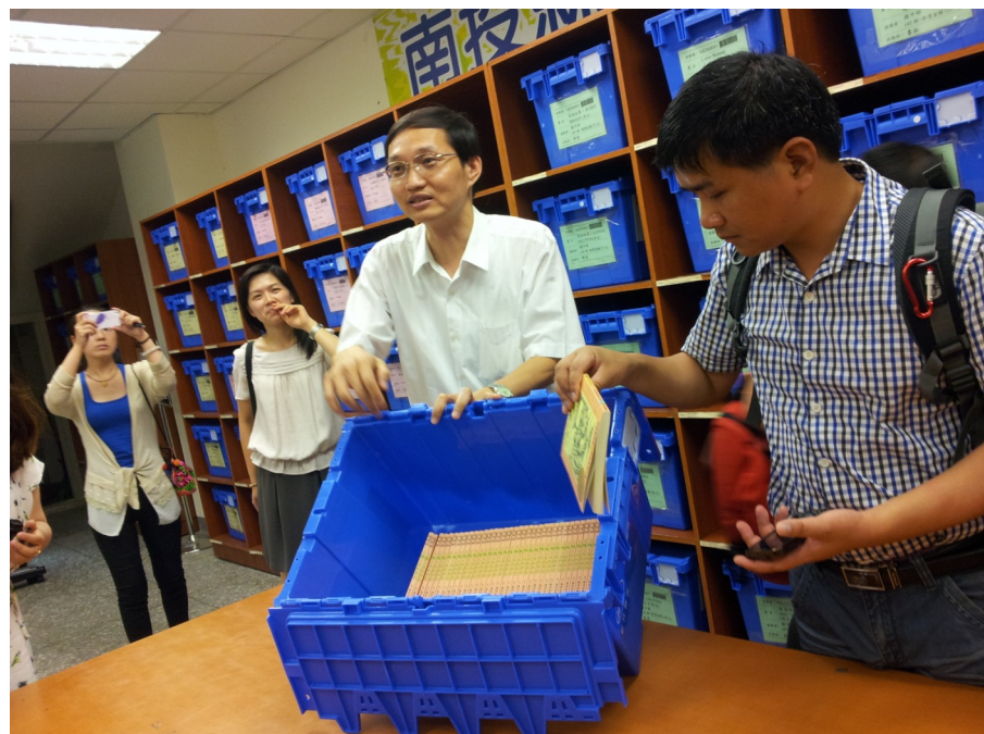
财团法人台湾阅读文化基金会—流动书箱