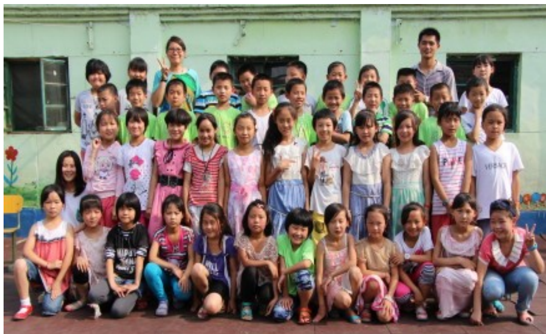
TFC的志愿者与同心小学毕业的孩子们合影。