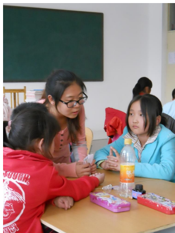
修齐老师在与学生交流