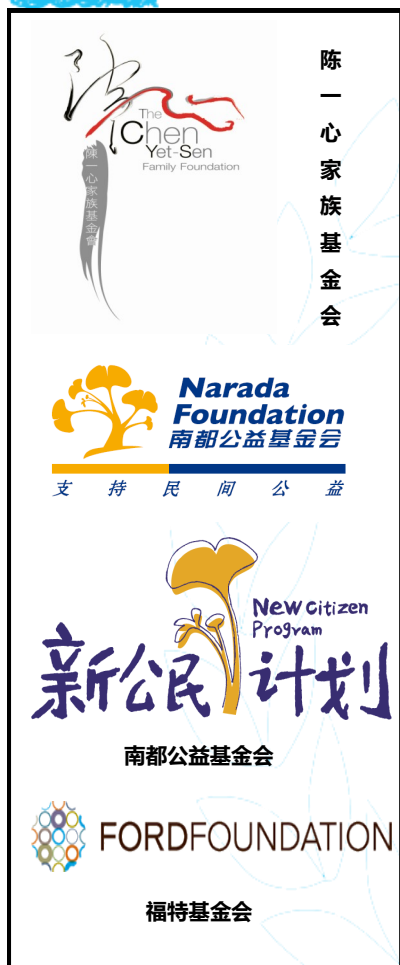
以上为本项目赞助基金会